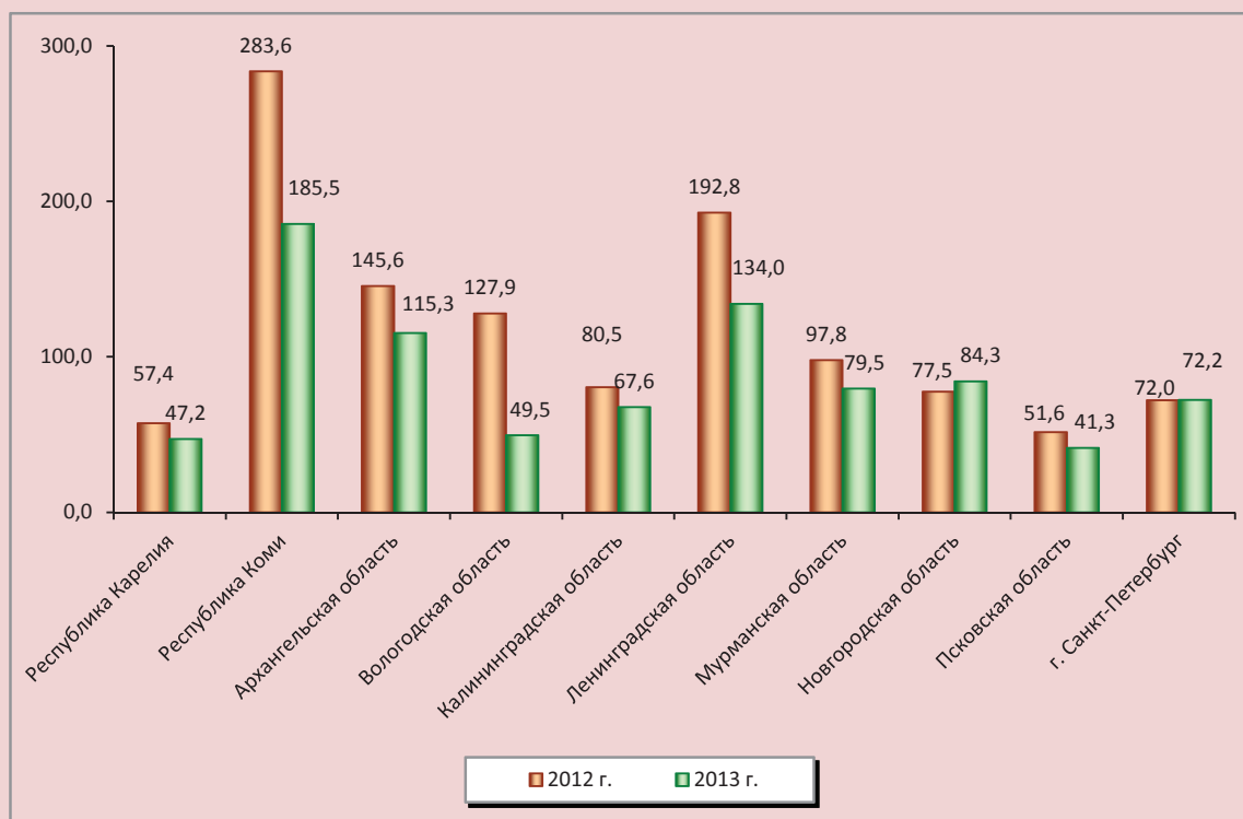
Рисунок 2. Инвестиции в основной капитал в СЗФО, тыс. руб. на душу населения (в сопоставимых ценах 2013 г.)