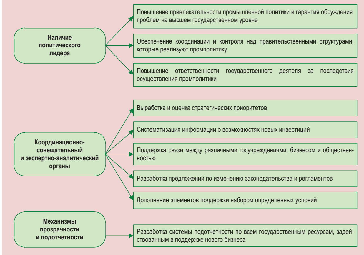
Рисунок 2. Формирование общественных институтов проведения промышленной политики [11]

изменений, корректировку рыночных сил за счет усиления или снижения эффекта распределения ресурсов, содействие в достижении синергетического эффекта, максимального увеличения собственного потенциала экономического роста, снижения рисков производственных потерь и погони за рентой. Такая промышленная политика может быть действенным инструментом