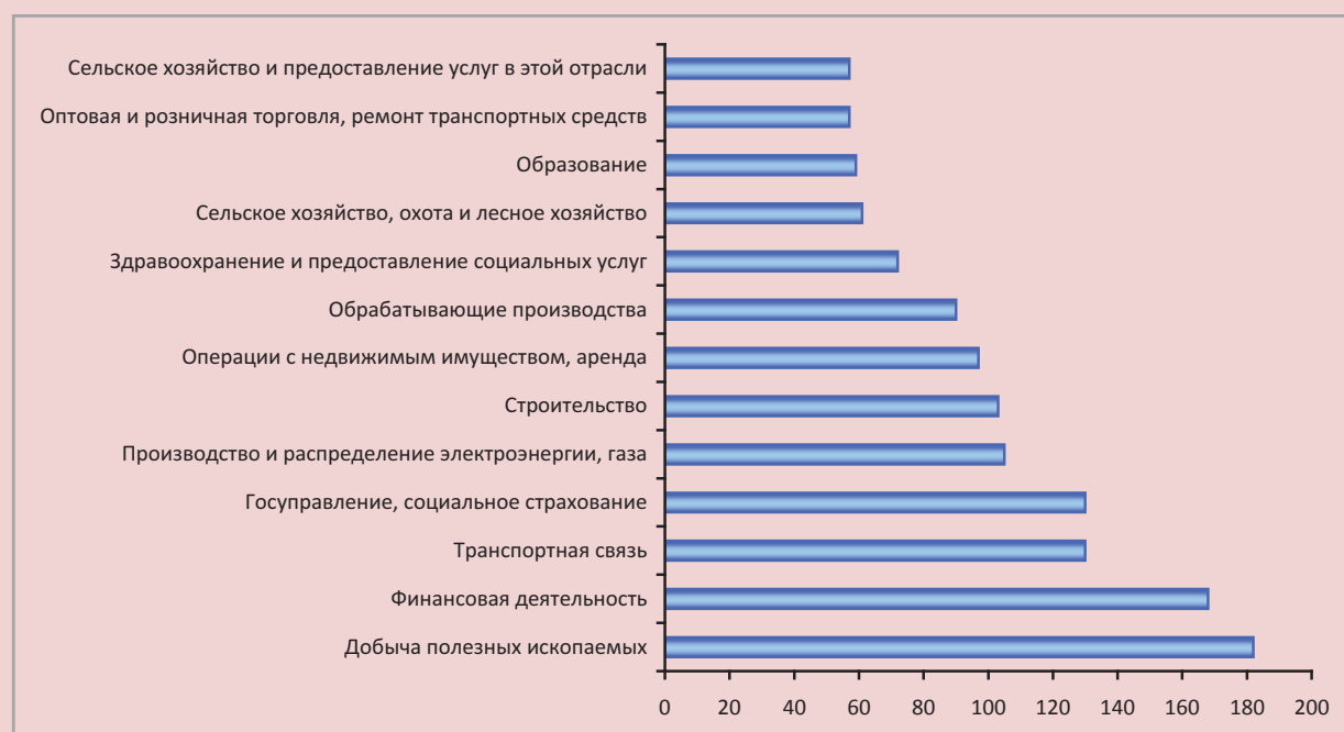
Рисунок 3. Отношение средней заработной платы работников организаций по отдельным видам экономической деятельности к среднему уровню по Республике Коми в 2011 г., %

В 2011 г., при среднемесячной номинальной начисленной заработной плате работников организаций (без субъектов малого предпринимательства) в среднем