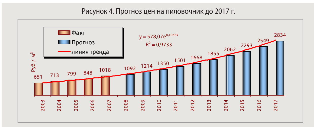
Таблица 1. Коэффициенты прогнозного изменения ставок (по отношению к 2007 г., в разах)

Итоговые показатели, отражающие удорожание ставок за предоставление в аренду участков для заготовки древесины и другие виды лесопользования, а также по договорам купли-продажи (без учета для собственных нужд) на корню представлены в таблице 1.