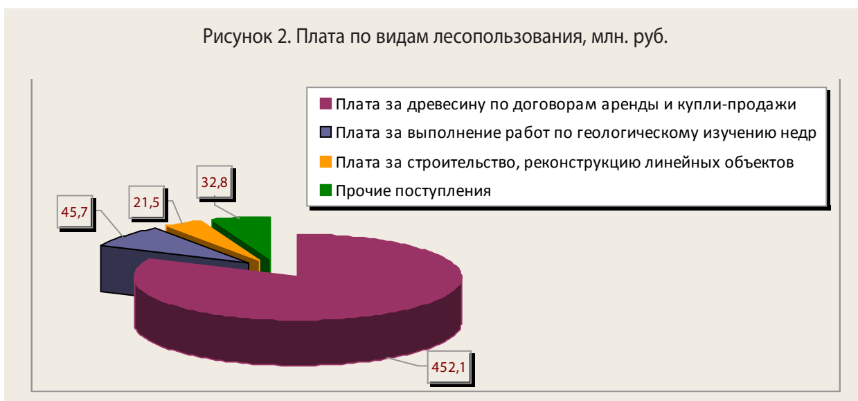
Рисунок 2. Плата по видам лесопользования, млн. руб.

Объемы платежей по видам лесопользования в Республике Коми приведены на рисунке 2. Наибольшие доходы бюджета приходятся на заготовку древесины – около 82%; затем идут доходы от выполнения работ по геологическому изучению недр, разработке месторождений – 8; от строительства, реконструкции, эксплуатации линий связи, дорог, трубопроводов – 4; прочие поступления – 6%.