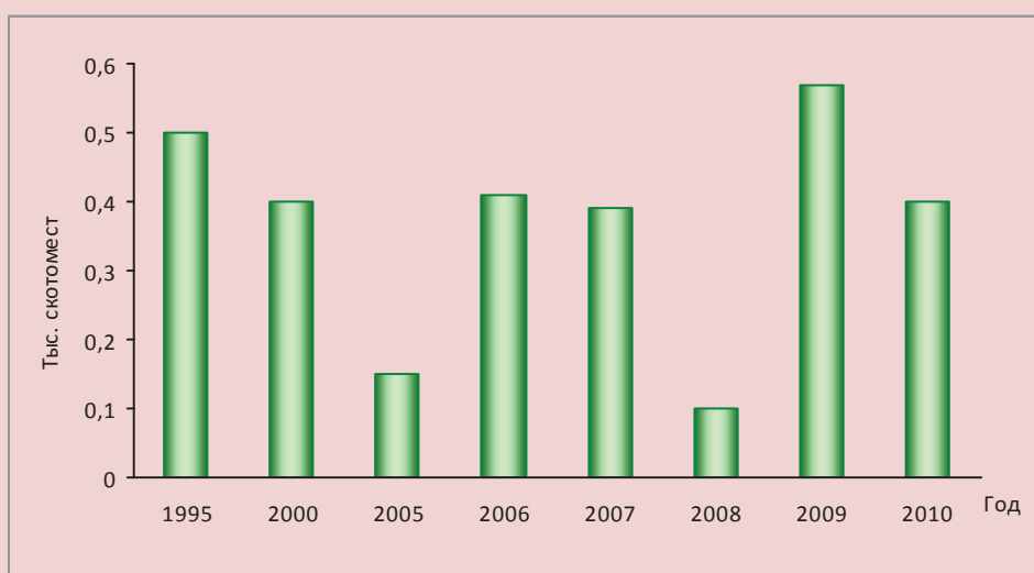
Рисунок 1. Ввод в действие производственных мощностей для крупного рогатого скота в Республике Коми в 1995 – 2010 гг., тыс. скотомест

Развитие скотоводства в высшей степени зависит от роста инвестиций и перехода к инновационным технологиям. За годы рыночных реформ существенно сократились инвестиции. Доля инвестиций в основной капитал сельского хозяйства Республики Коми в общей сумме инвестиций снизилась за 1990 – 2010 гг. с 5,7 до 0,8% при удельном весе сельского хозяйства в валовом региональном продукте 2,6%. Темпы снижения инвестиций в аграрный сектор более чем в четыре раза выше, чем в целом по республике [2, с. 26].