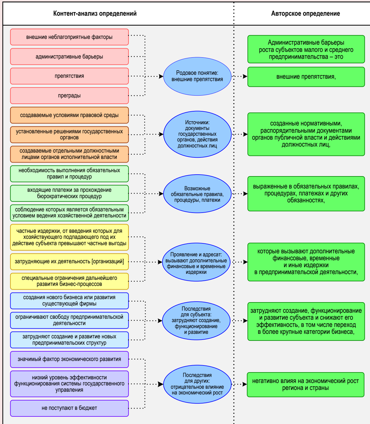
Рис. 1. Контент-анализ понятий, близких к термину «административный барьер роста» МСП