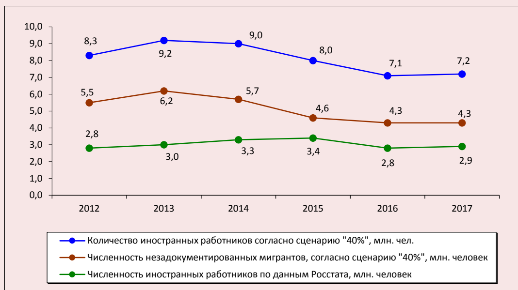
Рис. 2. Динамика оценочной общей численности иностранных работников на российском рынке труда