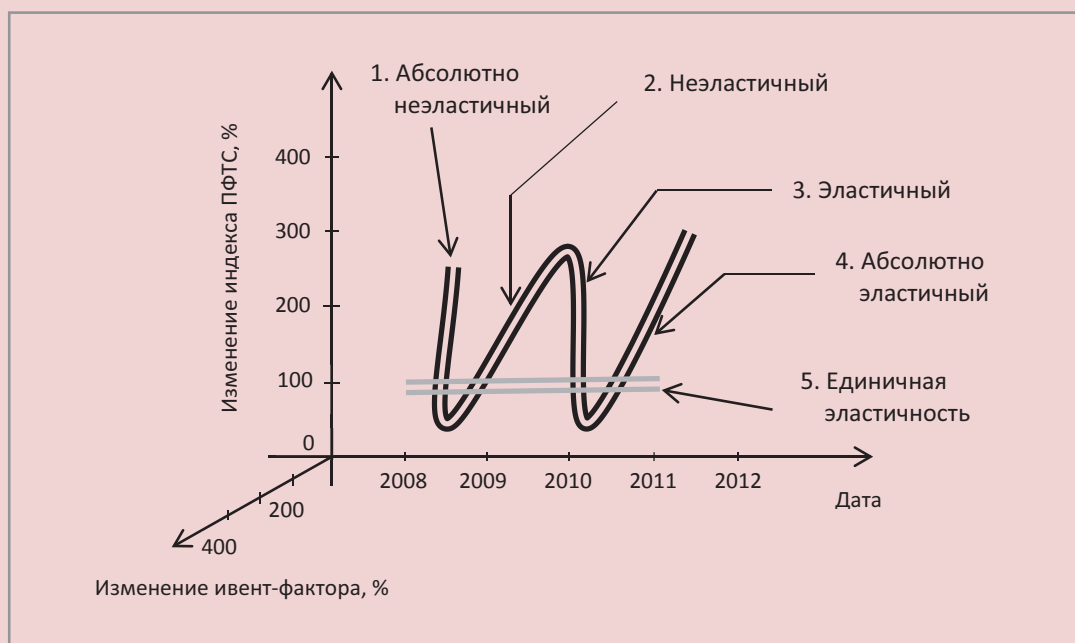
Рисунок 3. Схематичная диаграмма рассеяния с привязкой к формам эластичности*

Линия, которая проходит через все группы, содержит случаи с единичной эластичностью, и, соответственно, переход от одной группы приблизительно проходит через данную область.