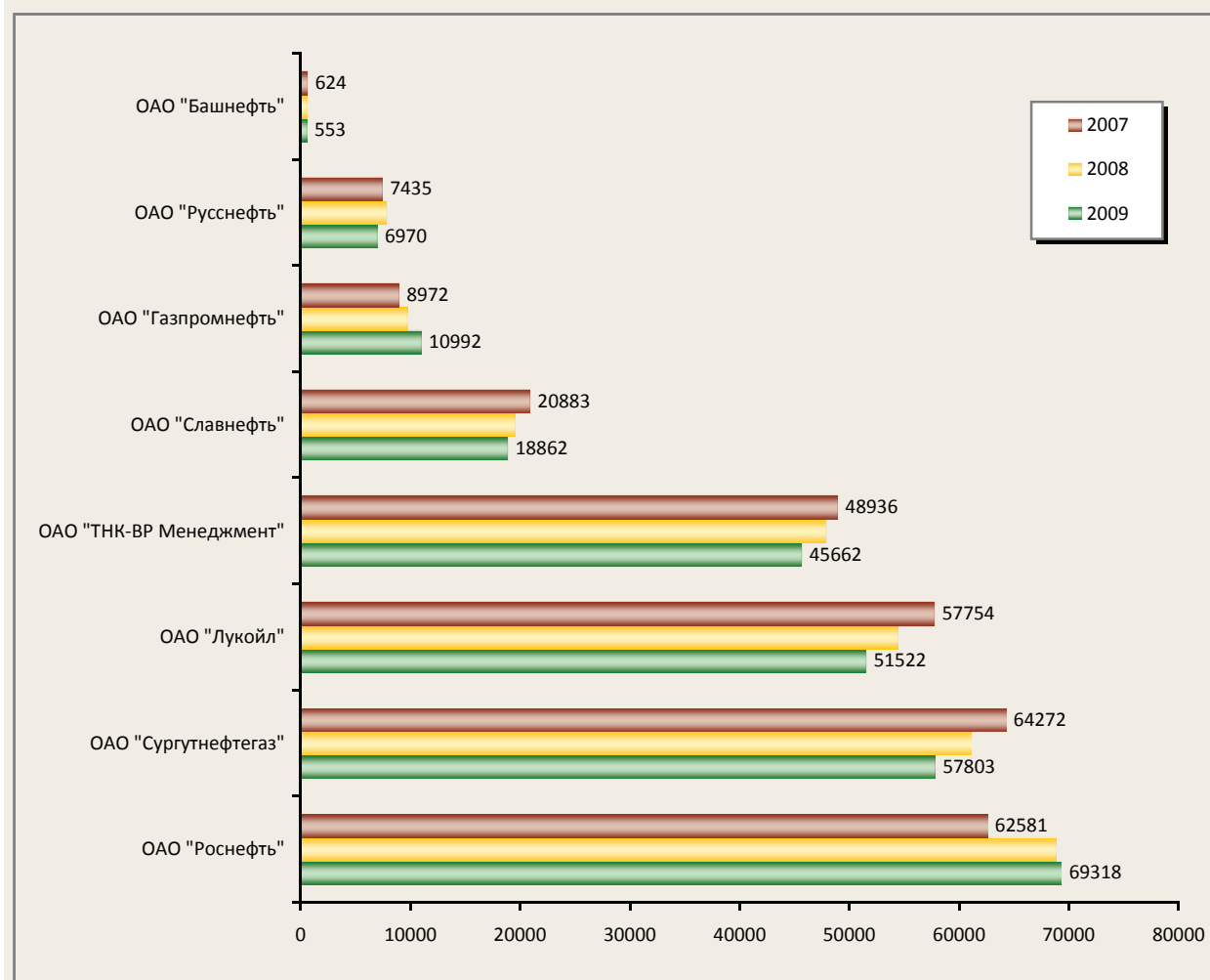
Добыча нефти на территории ХМАО – Югры в разрезе вертикально-интегрированных нефтяных компаний, тыс. тонн