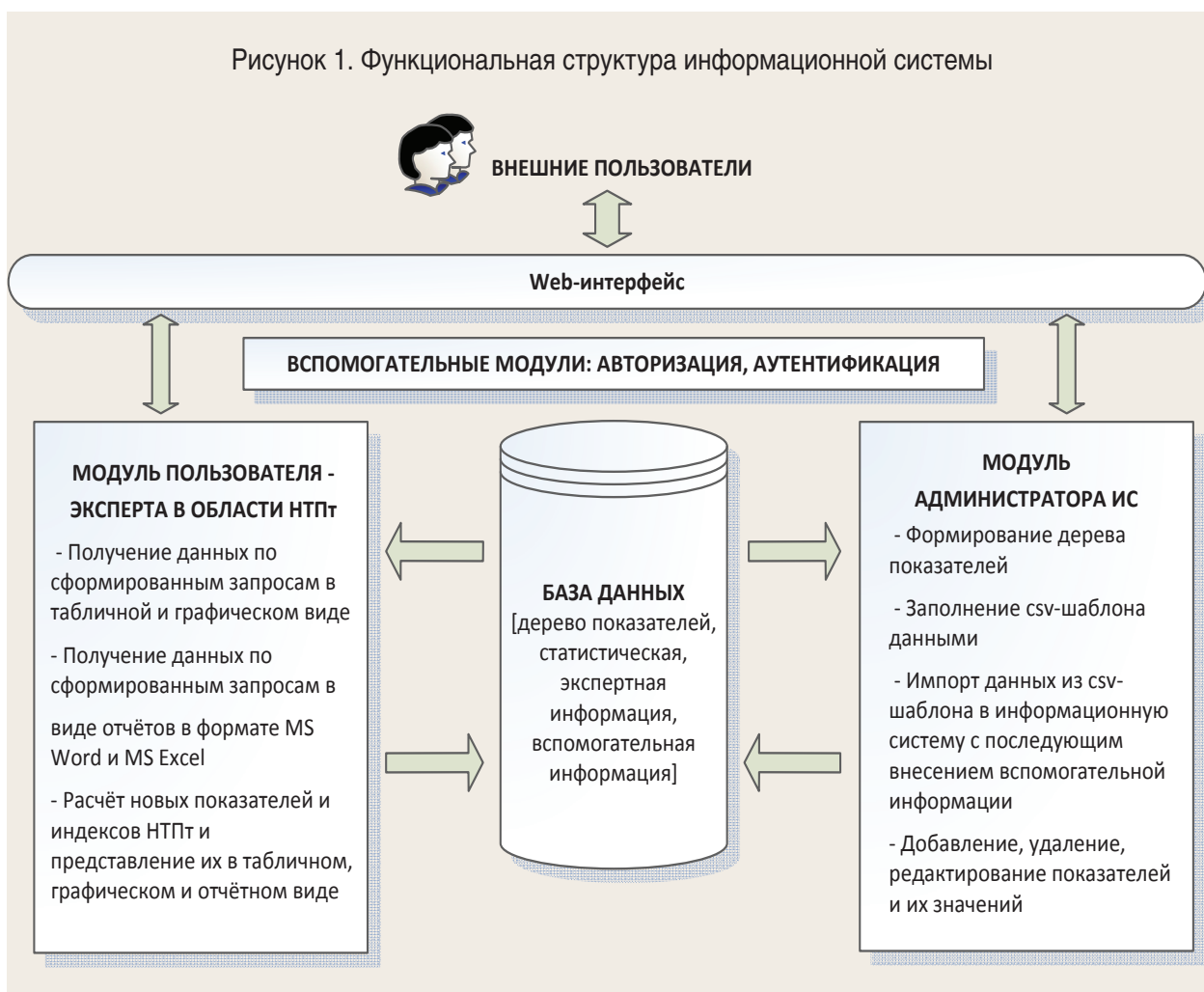
Рисунок 1. Функциональная структура информационной системы

Вход представляет собой информацию, преобразуемую функциональным блоком. Для данной модели изначальной входной информацией являются статистическая информация (отдельные показатели и сводный индекс) и результаты экспертных опросов (например, руководителей предприятий и заведующих кафедрами вузов).