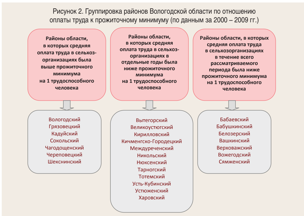
Рисунок 2. Группировка районов Вологодской области по отношению оплаты труда к прожиточному минимуму (по данным за 2000 – 2009 гг.)

Если в целом по области уровень заработной платы соответствовал нормам прожиточного минимума в среднем на трудоспособного человека, то в ряде районов он был ниже их даже в относительно стабильные годы (рис. 2).