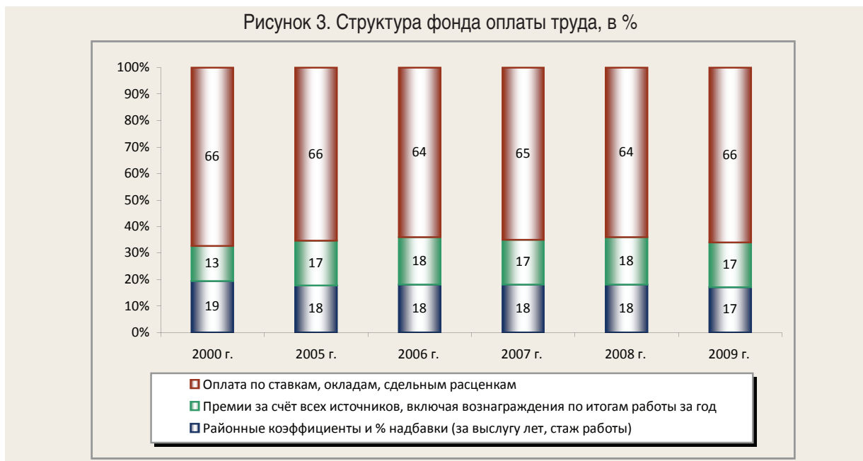
Рисунок 3. Структура фонда оплаты труда, в %